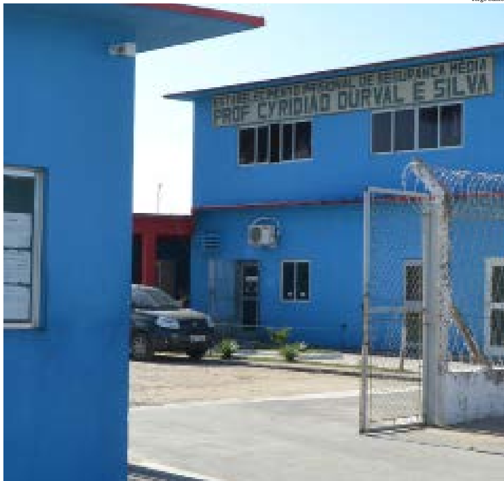
Estado investe em melhores condições de trabalho para os agentes penitenciários

“O Estado tem investido na aquisição de materiais e na modernização dos presídios. Com melhores condições de trabalho os agentes penitenciários fortalecem a segurança dentro e fora das unidades prisionais e promovem a ressocialização dos custodiados”, afirma o coronel Freitas.