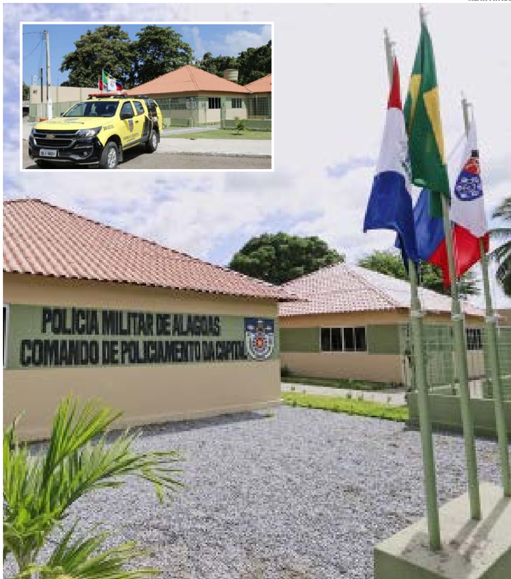
1º BPM é responsável pelo policiamento ostensivo de 14 bairros da capital

Nos últimos meses, o Governo inaugurou o novo IML, a nova sede Radiopatrulha, que foi totalmente reconstruída, e a Delegacia de Homicídios e de